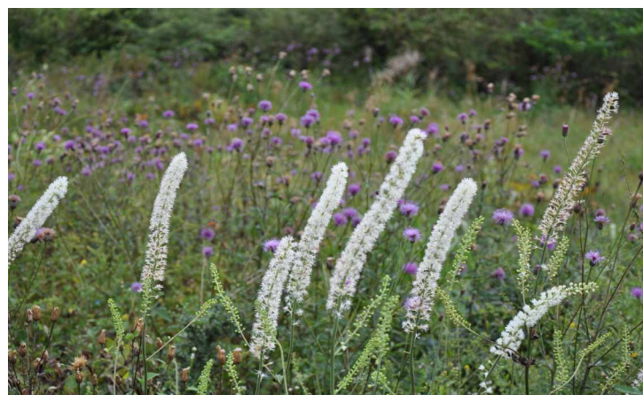
▲ 秋の花々がたくさん咲いていました