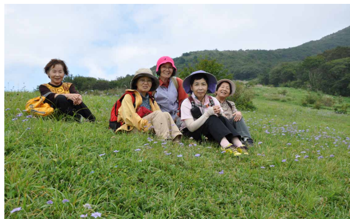
▲ 花畑のなかでみなさんと

エルクフラワーガールの皆様と《初秋の山野草》を楽しみに広島県の吾妻山ロッジを訪ねました。気持ちの良い青空の下まず目に映ったのは、秋の爽やかな風に揺れるマツムシソウの群生でしたそして・・・アケボノソウ・ツリフネソウ・ウメバチソウ・ワレモコウ・カワラナデシコなどが咲き競うお花畑を楽しくハイキング～♪花を愛でながらのコーヒータイムも至福の時間でした。